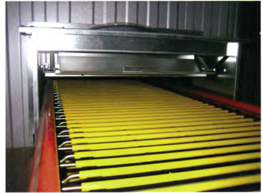
実用新案登録済み